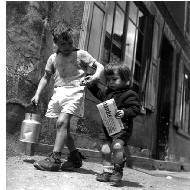
Robert Doisneau "Rue Marcelin Berthelot"